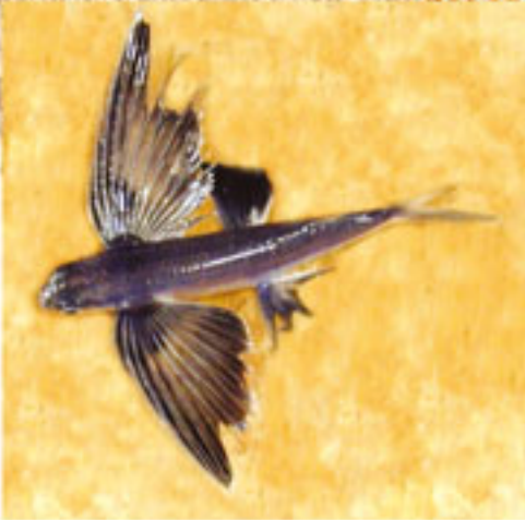
Uçan Balık Dönem: Mezozoik zaman, Kretase dönemi Yaş: 95 milyon yıl Bölge: Lübnan