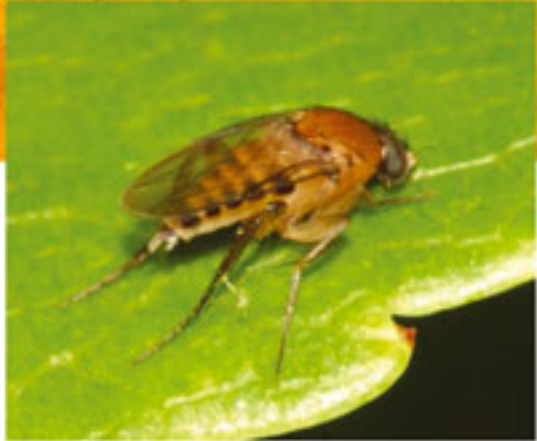
Kambur Sinek Dönem: Senozoik zaman, Eosen dönemi Yaş: 45 milyon yıl Bölge: Rusya