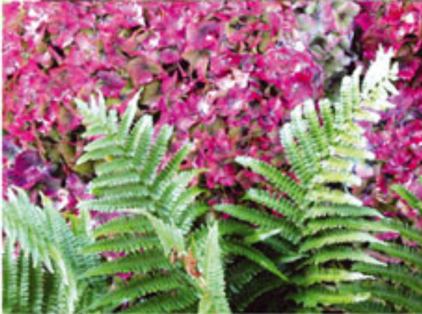
Eğrelti Otu Dönem: Paleozoik zaman, Karbonifer dönemi Yaş: 300 milyon yıl Bölge: İngiltere