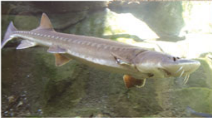
Mersin Balığı Dönem: Mezozoik zaman, Kretase dönemi Yaş: 144 - 65 milyon yıl Bölge: Çin