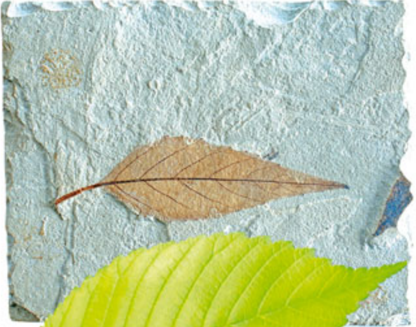
Çitlembik Yaprığı Dönem: Senozoik zaman, Eosen dönemi Yaş: 45 milyon yıl Bölge: Green River Oluşumu, Wyoming, ABD

Orta büyüklükte bir ağaç olan çitlembikler ortalama 10-25 metre uzunluğundadırlar. Bulunan tüm çitlembik fosilleri, bu bitkinin günümüzdeki örnekleriyle bundan on milyonlarca yıl önce yaşamış örneklerinin tamamen birbirinin aynı olduğunu ortaya koymaktadır. Bu aynılık, evrim iddiasını yerle bir etmektedir.