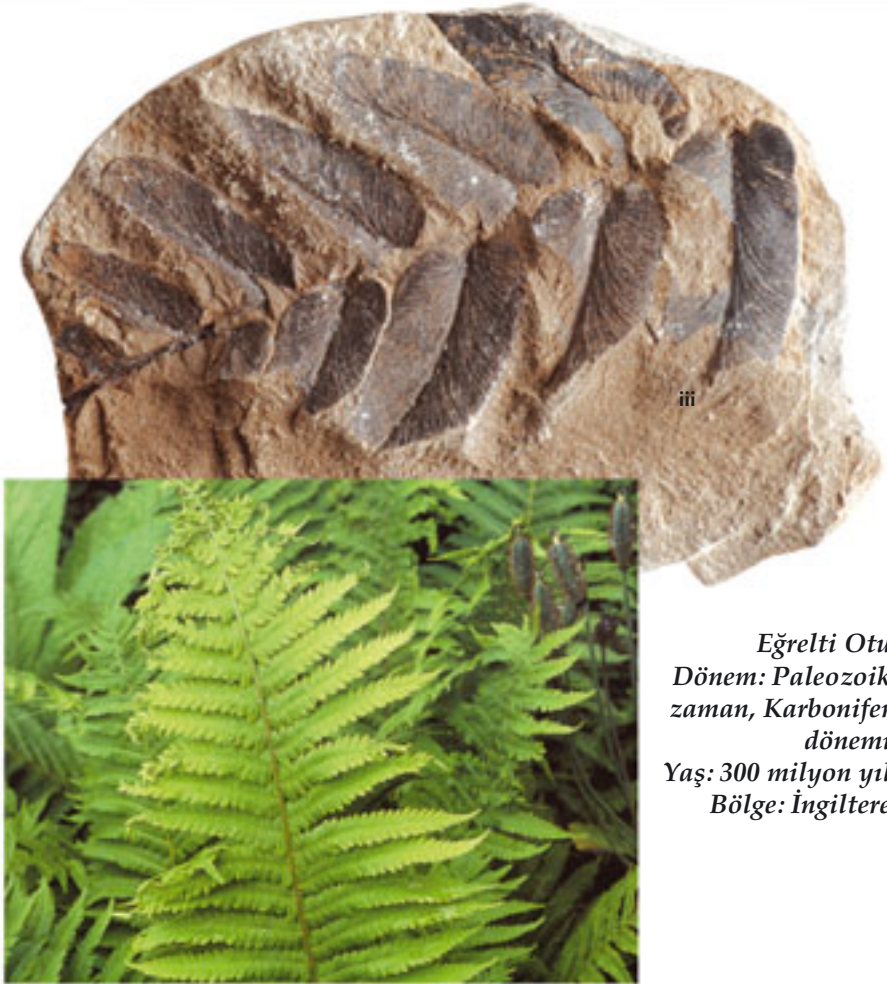
Eğrelti Otu Dönem: Paleozoik zaman, Karbonifer dönemi Yaş: 300 milyon yıl Bölge: İngiltere